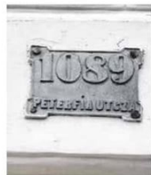
Sokáig látható volt a Kálvin téren a négyjegyű házszám, mára sajnos ellopták

A ma ismert rendszerezést csak ezután alakították ki: minden utca külön számozással indult a belváros felől, jobb oldalon a páratlan, bal oldalon a páros számozással. Emiatt több utcát is el kellett nevezni a derékutcákon belül, így 1893 környékén megjelentek a kisebb utcák elnevezésére tett javaslatok, s 1899. május 1-én lettek véglegesítve. Ez a felosztás a mai napig bevált, és megőrizte a formáját. HL