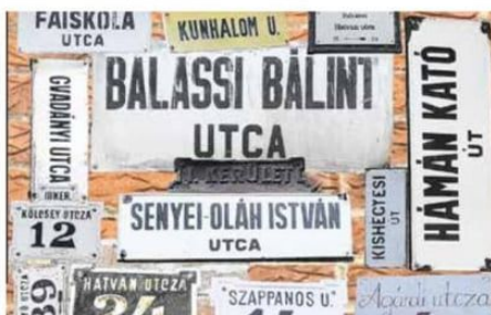
Utcatáblák különböző korszakokból