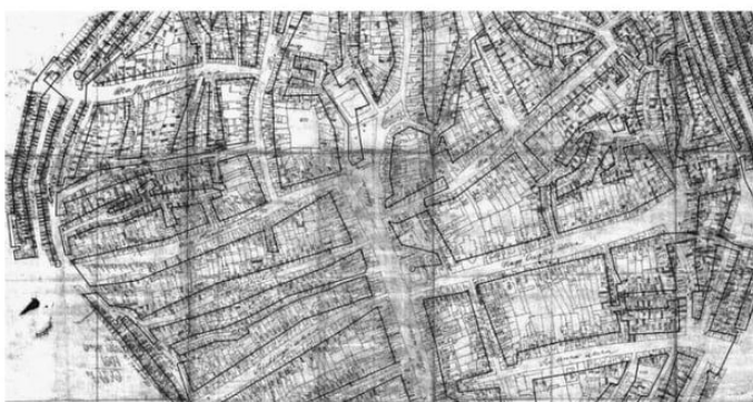
Debrecen térképe 1877-ből, a fekete vonalak a sorszámozás irányait jelölik

Ezután 1845-ben nagyjaink úgy gondolták, hogy sokkal